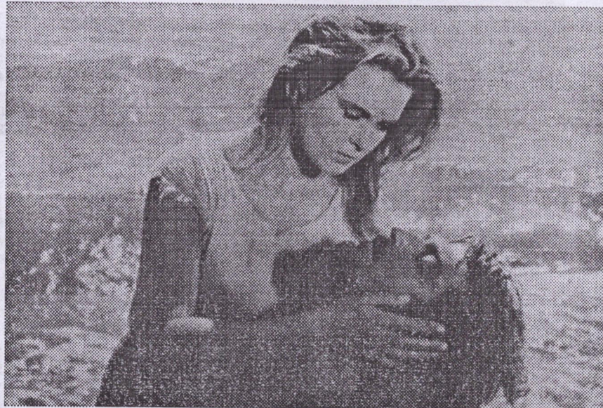
LE FILM SOVIETIQUE DE GUERRE

emphase, d'une caméra légère mobile comme les péripéties de l'action nous content cette histoire passionnante de bout en bout.